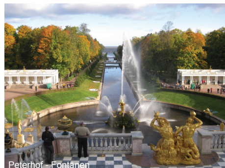
Peterhof - Fontänen