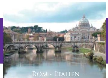
ROM – ITALIEN