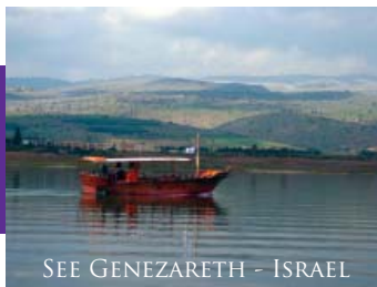
SEE GENEZARETH – ISRAEL