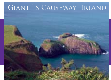
GIANT'S CAUSEWAY- IRLAND