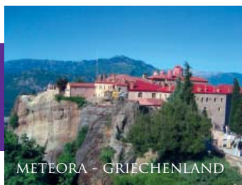
METEORA - GRIECHENLAND