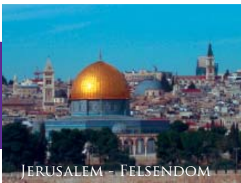
JERUSALEM – FELSENDOM

Flug nach St. Petersburg – Stadtrundfahrt – Winterpalast des Zaren – Schlossplatz mit Alexander-säule und Triumphbogen – Admiralität – Mutter-Gottes-von Kasan-Kathedrale – Reiterdenkmal Peter des Großen – Sommergarten – Peter- und Pauls-Festung – Peter-Paul-Kathedrale – Alexander-Newski-Kloster – Isaak-Kathedrale – Aussichtsturm – Peterhof – Eremitage – Puschkin – Katharinenpalast – Alexanderpalast – Pawlowsk – Sommerpalast – Rückflug.