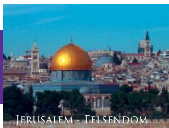
JERUSALEM – FELSENDOM

Flug nach Malta – Valletta – Upper Barracca-Gärten – St. John's Co-Kathedrale – Palast der Großmeister – Kirche des Hl. Paulus – Mdina – Kathedrale – Festungsmauern – Rabat – St. Paulus Katakomben und Grotte – Gozo – Dwejra – Zitadelle Victoria – Tempelanlage Ggantija – Xlendi – Marsalforn – Mosta – Kuppelkirche – Botanischer Garten – Marsaxlokk – Tempel Tarxien – Ghar Dalam – Birgu – Cospicua – Senglea – Rückflug.