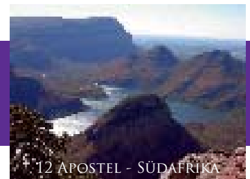
12 APOSTEL - SÜDAFRIKA