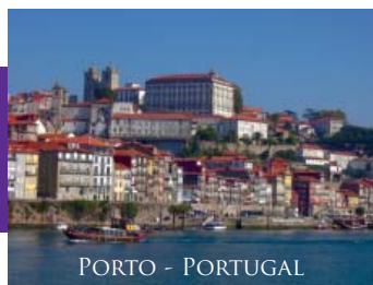
PORTO - PORTUGAL