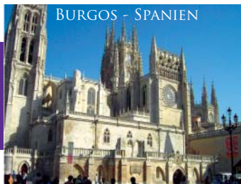
BURGOS - SPANIEN