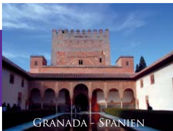
GRANADA - SPANIEN

Flug nach Taschkent – Flug nach Urgentsch – Chiwa – Tugay-Savanne – Amu Darya – Wüste Kizilkam – Buchara – Ark – Bolo Hauz-Moschee – Samaniden-Mausoleum – Chaschma Ayub – Poikalon-Komplex – Miri-Arab Medresse – Kalon Moschee – Medresse Abdul Aziz Khan – Labi-Hauz-Komplex – Serawschan-Gebirge – Schachrisabs – Gok Gumbas-Moschee – Große Seidenstraße – Samarkand – Mausoleum Gur Emir – Moschee Bibi Chanim – Bazar – Theater für orientalische Trachten – Taschkent – Museum – Medresse Abdul Kassim – Stadtrundfahrt – Rückflug.