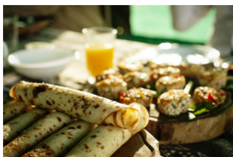
Camp - Verpflegung

Die Nutzung u. a. von Verkehrsmitteln hat Auswirkungen auf Klima und Umwelt. Einen persönlichen Beitrag zum CO 2 -Ausgleich können Sie beispielsweise an folgende Organisationen leisten: Myclimate, Atmosfair, Arktik, Climate Partner. Weitere Informationen zu freiwilliger CO 2 -Kompensation finden Sie unter: https://www.umweltbundesamt.de/themen/freiwillige-co2-kompensation .