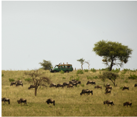
Safari - Herdenwanderung