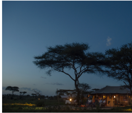
Pembezeni - Mobiles Camp