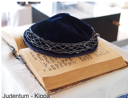
Judentum - Kippa