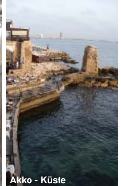
Akko - Küste