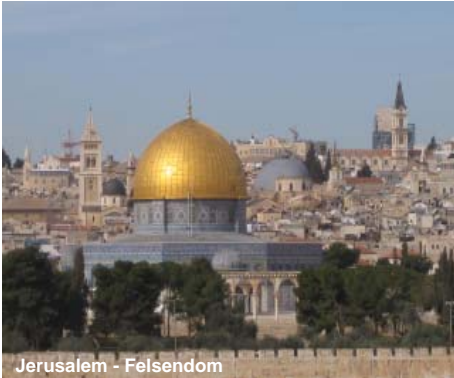
Jerusalem - Felsendom

Rundreise durch das Heilige Land diesseits und jenseits des Jordan