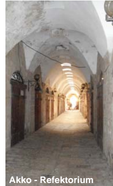
Akko - Refektorium