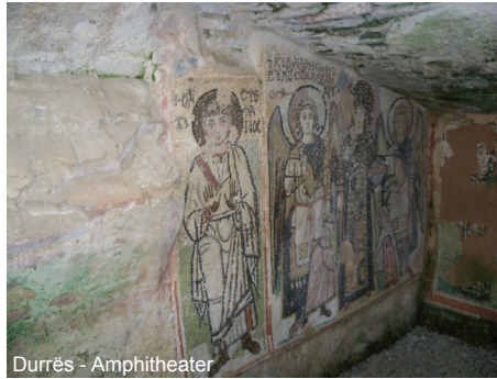
Durrës - Amphitheater