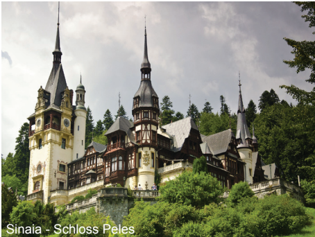
Sinaia - Schloss Peles